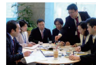
プロジェクト会議

住宅において環境負荷が最も高いのは、建築段階よりも入居者による「使用段階」と言われています。日々の生活における何気ない環境活動の積み重ねが、住宅全体の環境負荷について関心を持ち、環境に配慮することにつながります。本投資法人は、“入居者とともに推進するエコ”をテーマに、入居者と積極的にコミュニケーションを重ねながら、「楽しく、気分良く、自然に取り組みるエコ活動」を展開していきたいと考えています。